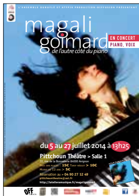
De l'autre côté du piano Avignon 2014